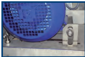
Besonders einfaches Spannen des Antriebsriemens