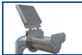
Option: Klappbare Abdeckung am Absaugkasten zur Reduzierung des Ansaugeräusches