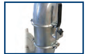
Option: Drosselklappe zum Einstellen der Luftmenge

Änderungen vorbehalten. Abbildungen zeigen auch Optionen und Zubehör, die nicht zum Standardlieferumfang gehören.