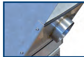
Option: Abluftanschluss an zentrales Luftsystem zum Abführen der Abluft