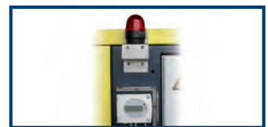
Option: Differenzdruckmessung zur Anzeige des Filterwechsels

Änderungen vorbehalten. Abbildungen zeigen auch Optionen und Zubehör, die nicht zum Standardlieferumfang gehören.