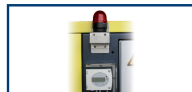
Option: Differenzdruckmessung zur Anzeige des Filterwechsels

Änderungen vorbehalten. Abbildungen zeigen auch Optionen und Zubehör, die nicht zum Standardlieferumfang gehören.