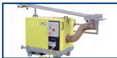
Option: Sonderabsaugkasten kombiniert mit Strangführung