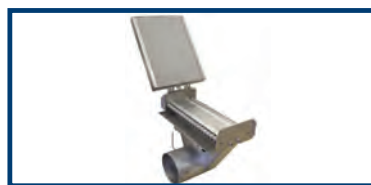
Option: Zusätzliche Schallkapselung am Absaugkasten