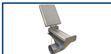
Option: Zusätzliche Schallkapselung am Absaugkasten