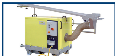
Option: Sonderabsaugkasten kombiniert mit Strangführung